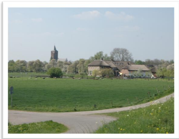
Boerderij De Haar