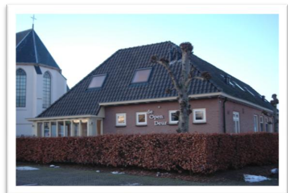
Verenigingsgebouw De Open Deur

De vergaderingen zullen plaatsvinden in het verenigingsgebouw van de Hervormde Kerk in Lienden en wel één keer per maand op zaterdagmiddag.